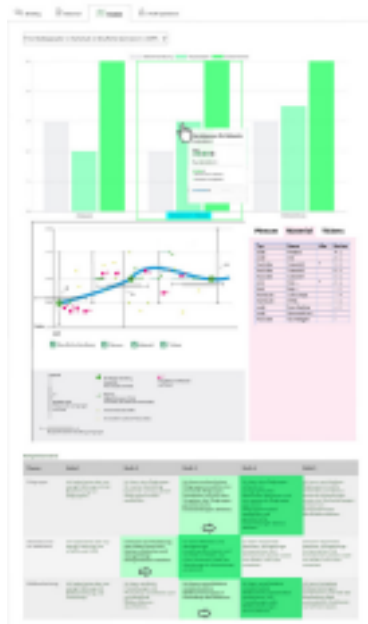
Berufliche Schule der Stadt X•

Es werden keine personenbezogenen Daten der Lernenden gespeichert. Die Lernenden nutzen smartPAPER ohne Anmeldung und exportieren ihre Daten in eine persönliche Textdatei. Verläufe der eigenen Bearbeitung und Statistik bereichern die Nachbesprechung im Team oder mit der Lehrkraft.